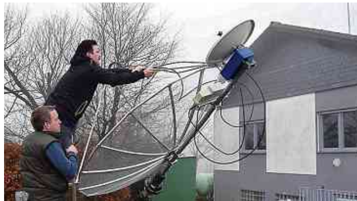
Vor dem Beginn des Wettbewerbs mussten auf dem Dümpel erst einmal alle Anlagen eingerichtet werden.

Nachdem auf dem Dümpel alle Anlagen eingerichtet waren, startete am Nachmittag der vom DARC ausgerichtete Wettbewerb, bei dem allein analoge Funktechnik zum Einsatz kam.